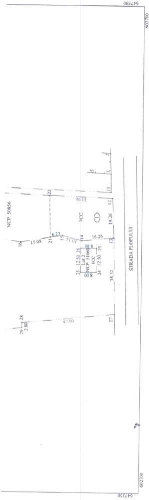
Tabel de miscare parcelara pentru alipire imobil